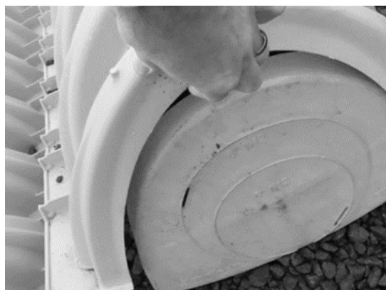
Figura 2. Colocación de las tapas

Se deben colocar tapas en el extremo inicial y final de las hileras formadas por las cámaras, para evitar la migración del material de relleno al interior de las cámaras. Las tapas están diseñadas para empalmarse manualmente, sin la ayuda de equipo o maquinaria y deberán de colocarse por debajo de una corrugación al extremo final de la cámara, de acuerdo con la Figura 2.