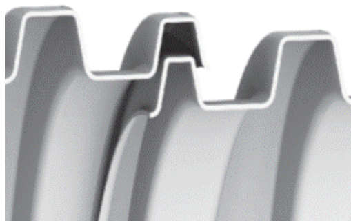
Figura 1. Empalme entre cámaras

Para unir las cámaras se empalman manualmente una a continuación de la otra, con la maniobra de una persona que podrá cargar y acomodar las corrugaciones de los extremos, sin usar equipo o maquinaria. Esto es posible porque el alto y ancho de las corrugaciones finales están diseñadas para empotrarse (ver Figura 1).