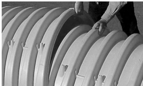
Figura 1. Empalme entre cámaras

Para unir las cámaras se empalman manualmente una a continuación de la otra, una persona podrá cargar y acomodar las corrugaciones de los extremos, sin usar equipo o maquinaria. Esto es posible porque el alto y ancho de las corrugaciones finales están diseñadas para empotrarse (ver Figura 1).