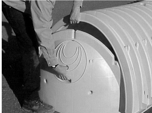
Figura 2. Colocación de las tapas

Se deben colocar tapas en el extremo inicial y final de las hileras formadas por las cámaras, para evitar la migración del material de relleno al interior de las cámaras. Las tapas están diseñadas para empalmarse manualmente, sin la ayuda de equipo o maquinaria y deberán de colocarse dentro de las corrugaciones de unión de las cámaras, de acuerdo con la siguiente Figura 2.