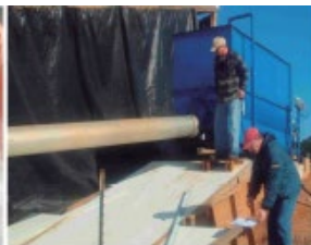
Hopper with outlet pipe leading to area inlet