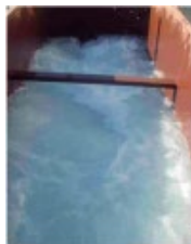
Inside view of hopper agitator

Pruebas de eficiencia de filtración, TSS y TPH realizadas en gran escala, condiciones reales en un laboratorio acreditado de pruebas de control de erosión.