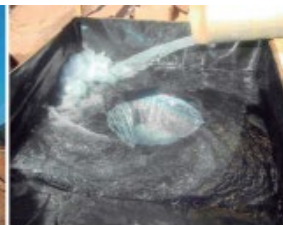
Area inlet simulated showing influent discharge from pipe